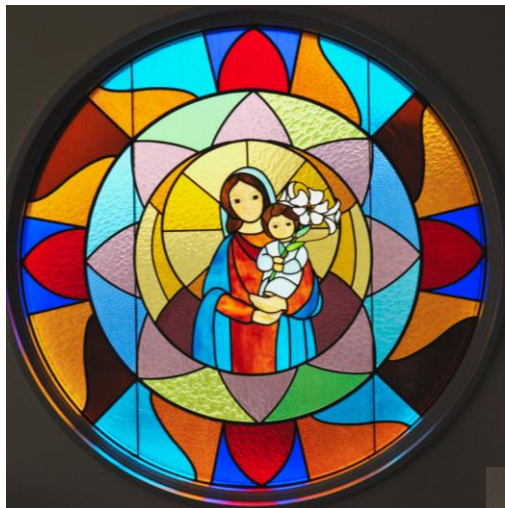
図書館棟3Fステンドグラス