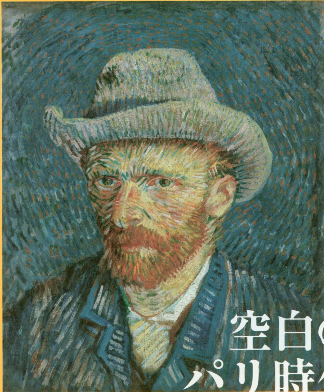
《グレーのフェルト帽の自画像》 Vincent van Gogh (1853 - 1890) Self-portrait with grey felt hat, 1887 Paris oil on cotton, 44.5 x 37.2 cm Van Gogh Museum, Amsterdam (Vincent van Gogh Foundation)