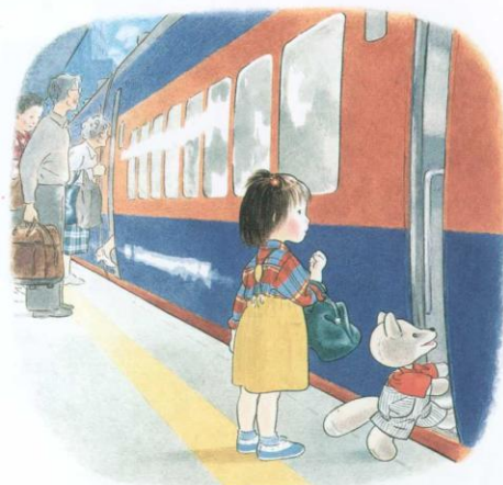
林明子《こんとあき》1989年