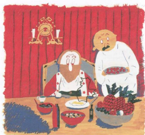
長新太《おしゃべりなたまごやき》1972年