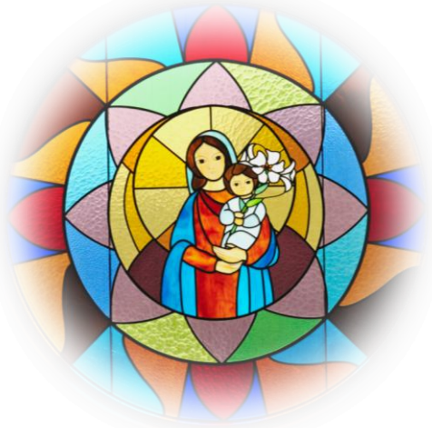
図書館棟3Fステンドグラス