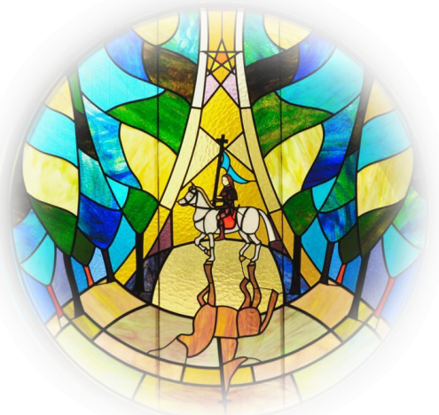
図書館棟1Fステンドグラス