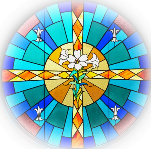
図書館棟 2Fステンドグラス